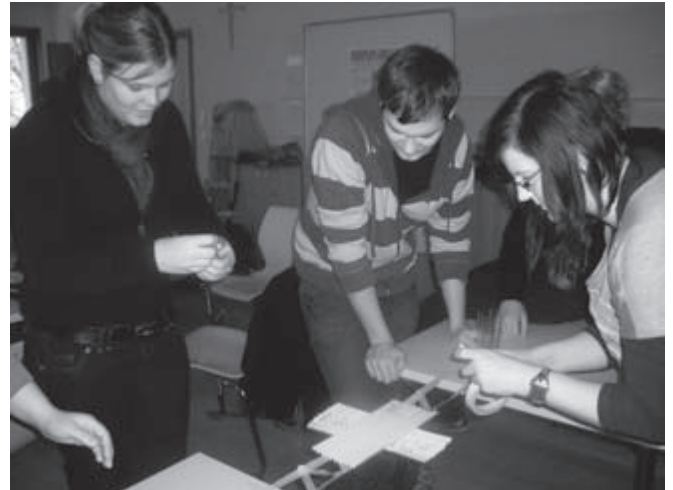
Ein Element der Klausur bestand darin, im Team eine knifflige Aufgabe zu lösen. Aus Klebestreifen und Papier musste eine möglichst stabile Brücke gebaut werden.

Mit der Reflexion endete ein sehr kreatives und erfolgreiches Klausurwochenende.