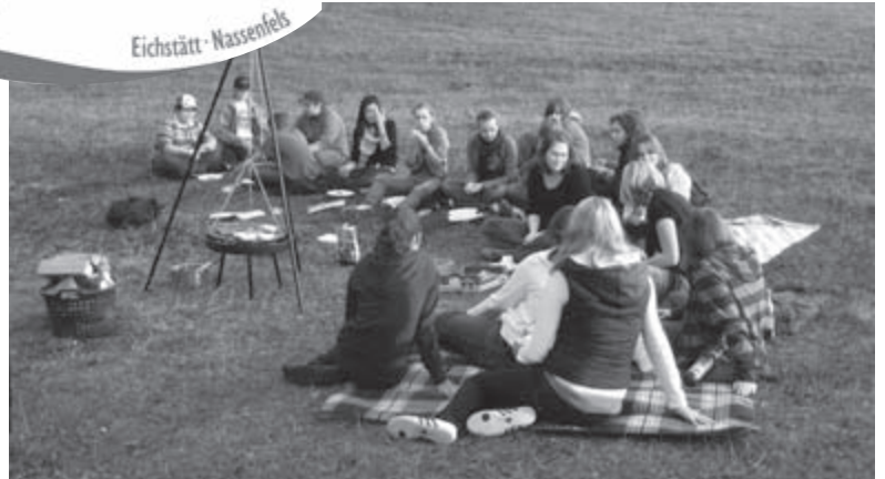
In Eichstätt war es möglich am 19. September 2009 eine ultimative GPS-Schnitzeljagd durch das Unterholz bei Eichstätt durchzuführen mit anschließendem Gottesdienst und Lagerfeuer.