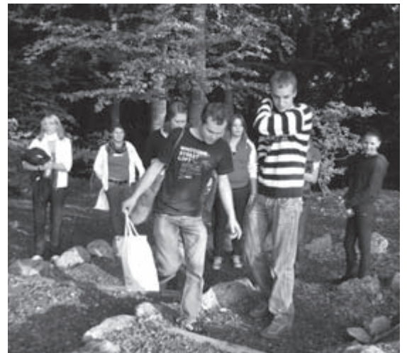
Die Gruppe der OG Rupertsbuch bei der Suche des letzten Cache kurz vor dem Ziel am Frauenberg.