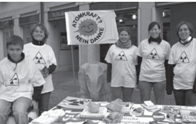
Die KLJB des Bistums zeigte am bundesweiten Anti-Atomkrafttag am Eichstätter Marktplatz Flagge.

So aber standen die Mitglieder des Arbeitskreises „Genesis“ alleine mit ihrem „Atomkraft – nein danke“ Plakaten und T-Shirts im Mittelpunkt des Interesses der Passanten. Und die waren