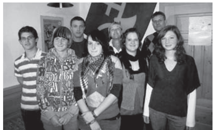
Der gelungene Generationswechsel bringt neuen Schwung und Elan in die KLJB Kottlingwörth