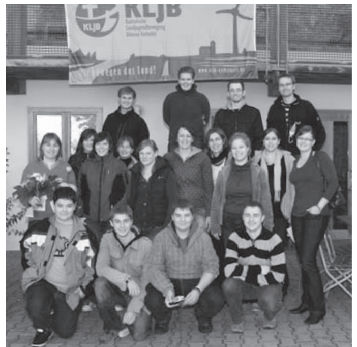
Ein letzter Rest der Teilnehmer der Diözesanversammlung 2009 beim Gruppenfoto am Sonntagvormittag.