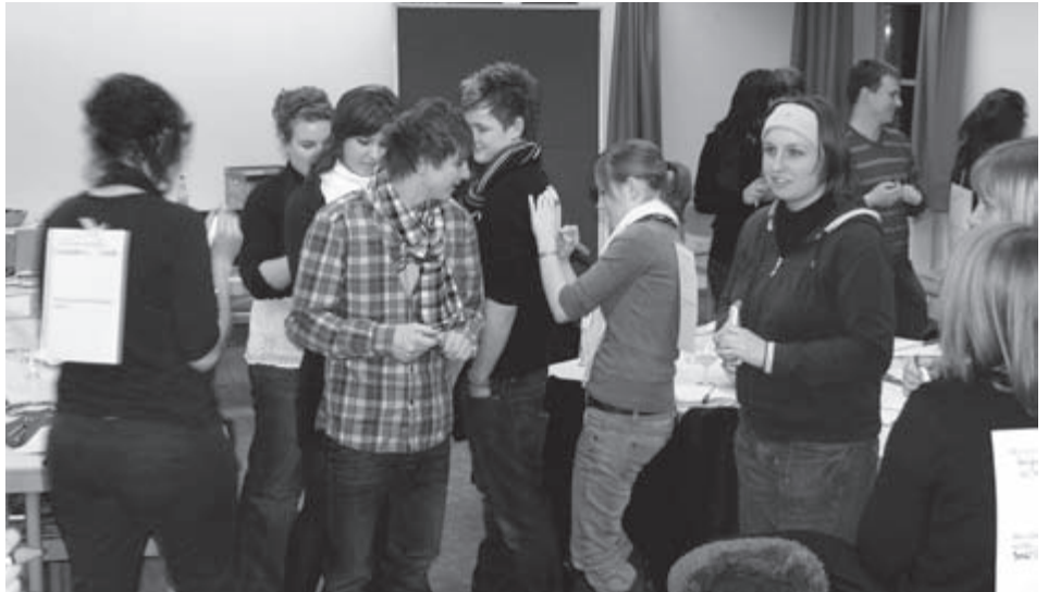
Einige Delegierte des Neujahrs-DA beim Vorstellungsspiel. Dabei waren alle aufgefordert, auf einem Zettel am Rücken des anderen aufzuschreiben, was man von demjenigen/derjenigen schon weiß bzw. immer schon mal wissen wollte.

Freite Mitarbeiterin der DL für Öffentlichkeitsarbeit