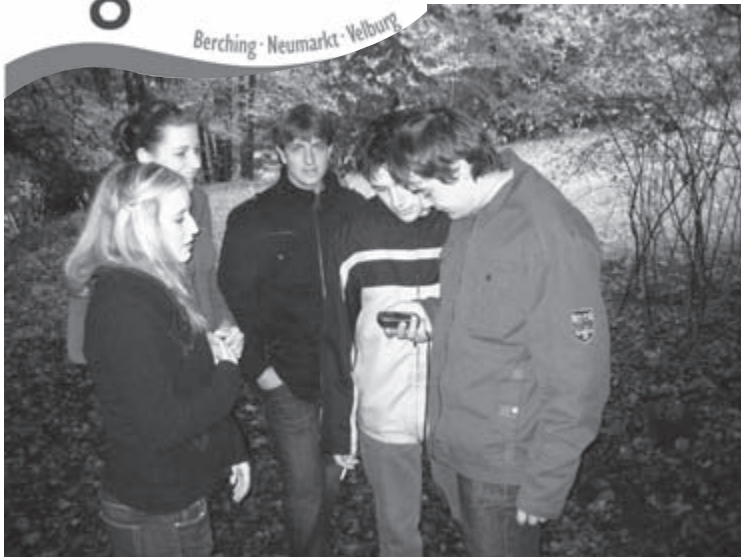
Die Gruppe der OG Waldkirchen/Freihausen versucht sich mit dem GPS-Gerät im Gelände zurecht zu finden.