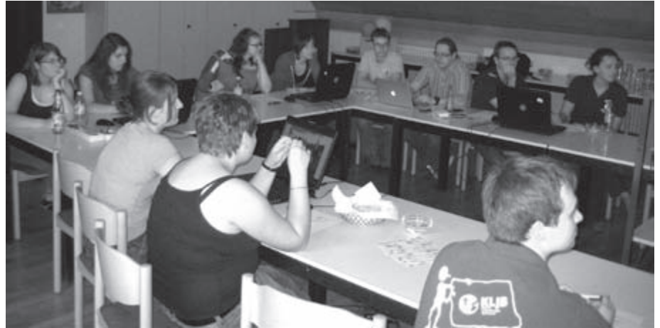
Die Teilnehmer der Aktion beim Gestalten der KLJB-Plakate unter Anleitung einer professionellen Mediengestalterin. Die Laptops für die Schulung bekamen wir leihweise vom Kreisjugendring Eichstätt.

Die Wemdinger initiierten eine Aktion mit politischem Hintergrund, gemünzt auf die Bundestagswahlen. Dort