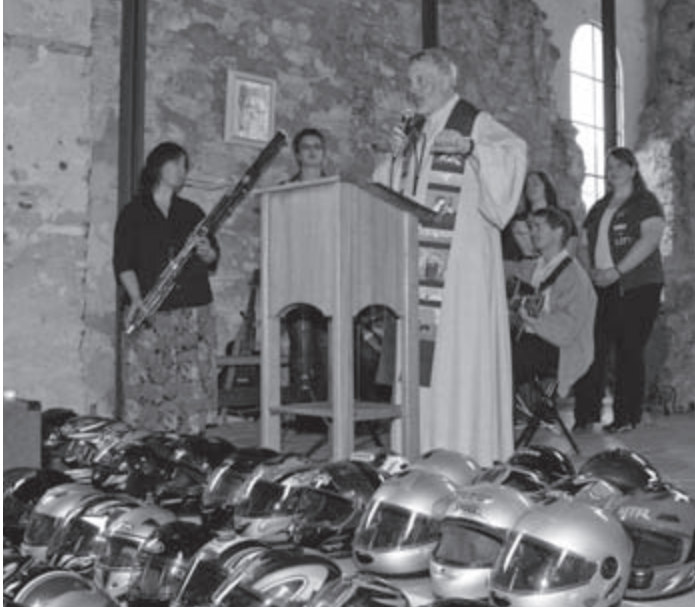
Eine feste Tradition: Vor dem Gottesdienst werden die Helme der Biker zu einem Kreuz drapiert

Rund sechzig Biker sind der Einladung der Katholischen Landjugendbewegung (KLJB) zur Motorradtour gefolgt. Start war am Samstag, 11. Juli 2009, in Eichstätt.