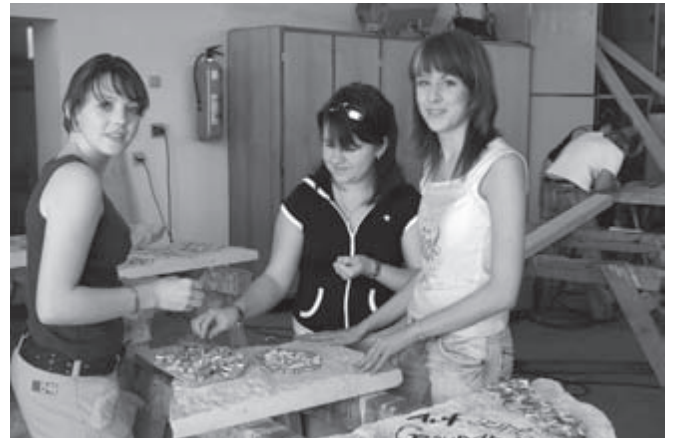
Die Jugend von heute ... engagiert sich fürs Dorf und die Gesellschaft, wie hier die Mitglieder der KLJB Wolfersstadt während 72 Stundenaktion „Zeit für Helden“