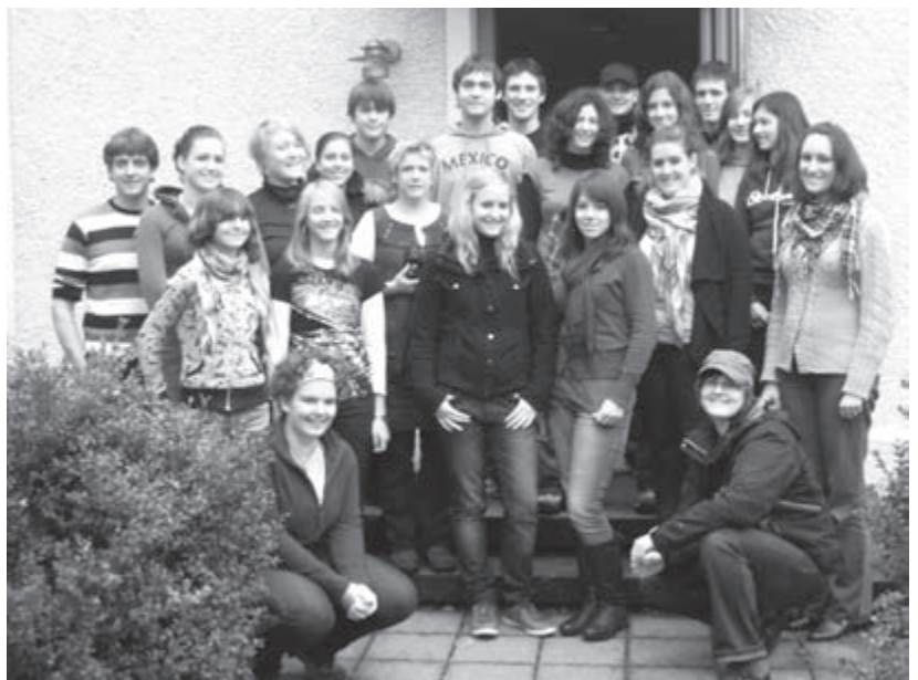
Gruppenfoto mit einigen Teilnehmern aus den OGs Waldkirchen/Freihausen, Waltersberg/Döllwang und Seubersdorf.