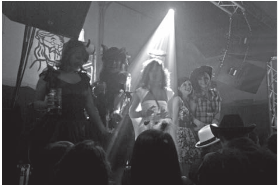
Neben den unzähligen Hippies war auch himmlischer Besuch vertreten