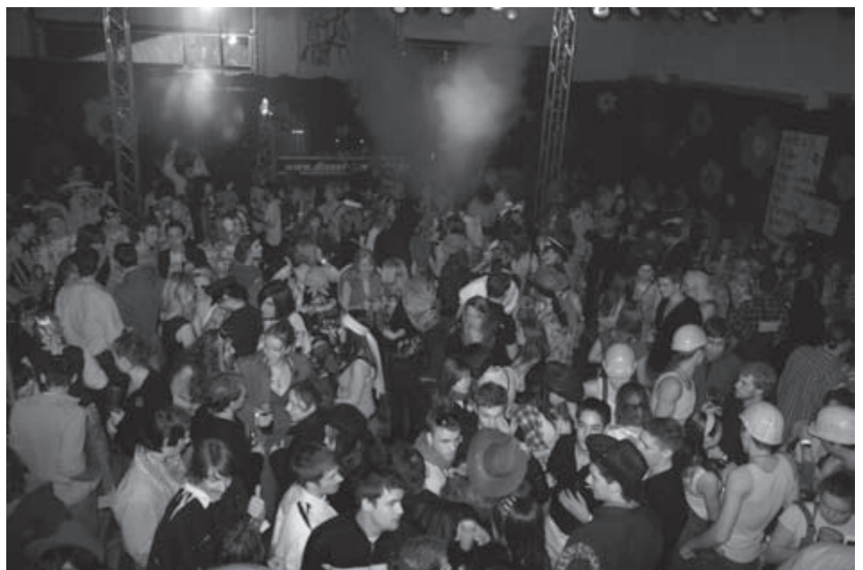
Brechend volle Tanzflächen und super Stimmung - der Hippieball 2010 der KLJB Rupertsbuch