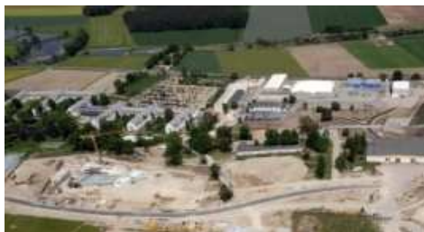
Fa. Adidas Herzogenau-